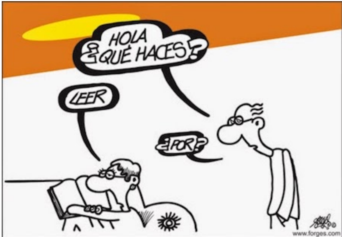
forges: ¿Qué haces? Leo ¿Por?

1 Por oír lo que alguien quiere decir sin tener que tenerlo presente.